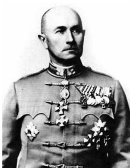
Vitéz Szombathelyi Ferenc

cok is egyre hevesebbé váltak. Szeptember 13-tól azonban újabb 200 km-es szakasszal nőtt az I. Gyorshadtest védősávja, mivel az ismételt átszervezéseknek köszönhetően a térségből kivonták a 16. német páncélos hadosztályt. Az 1. lovasdandár maradék két huszárosztályát is kénytelenek voltak alkalmazni a biztosító-védekező feladatok ellátására. Súlyossá váltak a veszteségek, az egységek kimerülése kezdett megmutatkozni. A 2. gk. dandár harcoló alakulatainak csaknem az 50%-a megsemmisült! A technikai eszközök, gépkocsik állapota katasztrofálissá vált, továbbá összességében az I. Gyorshadtest harckocsijainak több mint kétharmada szintén harcképtelenné vált! A magyar hadtestre „nehezedeő nyomás” szeptember közepe után kezdett enyhülni, a német 1. és 2. páncélos-csoport a szovjet Délnyugati Front alakulatait sikeresen bekerítette, a hadművelet fontosságát mi sem